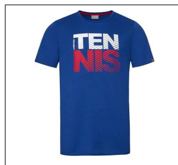
CAMISETA NON REGULAMENTARIA