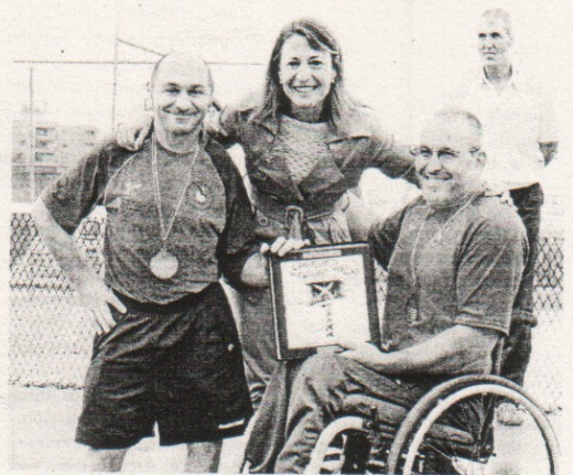
Los tenistas locales recibieron el trofeo por su segunda posición

El combinado de Aragón acompañó a las formaciones de Madrid y de Galicia en el podio, después de superar en el choque por el bronce al conjunto de Extremadura, cuarto. La quinta posición estuvo ocupada por el equipo de Castilla y León. ■